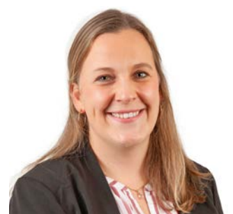
Katja Riem Nationalrätin, SVP, neu